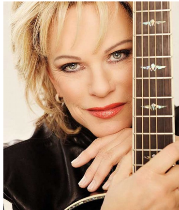
Lisa Fitz 8 ist Kabarettistin, Sängerin und Schauspielerin

Lisa Fitz ist eine vielseitige Künstlerin, die seit 1972 in der Öffentlichkeit steht: Mit kabarettistischen Solo-Programmen, in Theater und Fernsehfilmen. Sie veröffentlichte zahlreiche CD's und Bücher und erhielt viele Preise, zum Beispiel im Jahr 1990 den Deutschen Kleinkunstpreis.