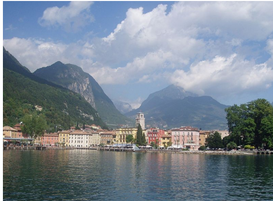
Riva del Garda