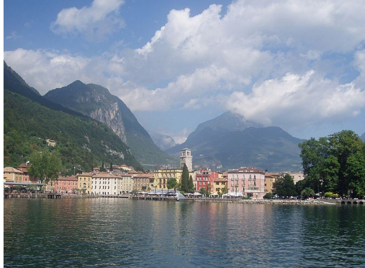
Riva del Garda